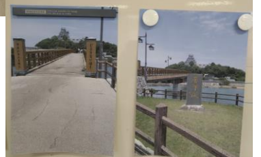
佐賀県・唐津市 城内橋