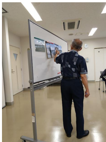
今日の活動の一コマ ~本人さんの 語りの様子~