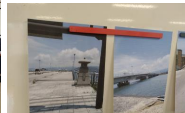
佐賀県・唐津市 舞鶴橋