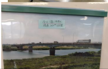
久留米市・合川大橋