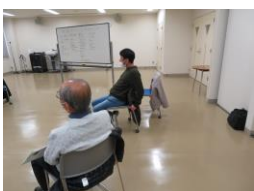
ご家族たちのミーティング