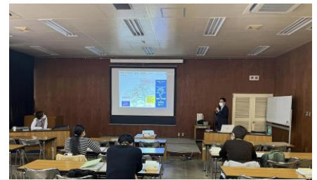
江頭の講演の様子です。

江頭からは、①わが国における認知症の現状、福岡県認知症医療センター、飯塚記念病院の取り組み ②認知症初期集中支援チームの事例、日頃の実践の中での認知症当事者、ご家族の声を紹介、③運転免許 に関する相談等について～当院の現状と課題～、④パーキングセンターIN いづかの取り組み、⑤ま とめ～私たちがこれから目指していくこととは？～という内容でした。