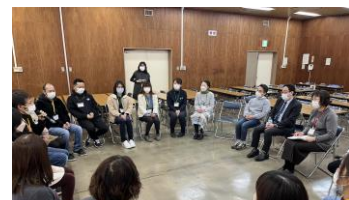
全員ディスカッションの様子です。

研修生一人一人の声を聞かせて頂くことにより、より深みが出て、その思いを 言語化し、共有することで私たちが、一人の人のために、何が出来るのか、