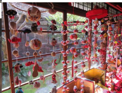
今日の活動の一コマ